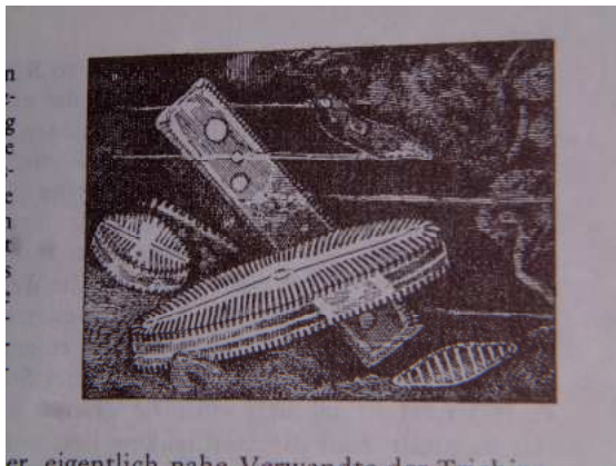
Ein Paar Lebewesen unter unserer Schuhsohle sind die Kieselalgen, Zeichnung France'

Ich finde es phantastisch, wie alles Leben aus dem Humus entsteht, der nichts anderes ist als tote Lebewesen, vermengt mit aufgelöstem Fels und Steinen dazwischen (die wie beim Kalkgestein oft wieder aus toten Lebewesen bestehen), sowie einer Vielzahl von Lebewesen (unter einer Schuhsohle mehr als Menschen auf der Erde) und dem Kot der Regenwürmer und anderer Kleintiere. Innerhalb kürzester Zeit riecht das Verweste und Verwesende appetitlich und gebiert neues Leben.